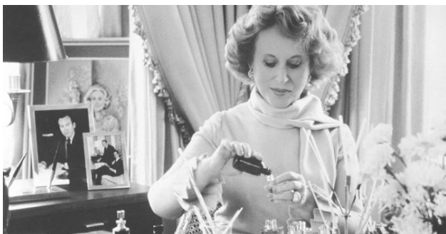
เอสเต ลอเดอร์ (Estée Lauder)

“ฉันไม่เคย...มัวผัน ถึงความสำเร็จ ฉันแค่...ทุ่มเททำมัน”